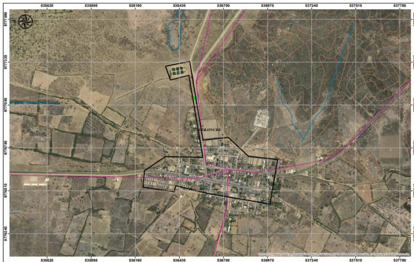
CONSTRUCCION DE SISTEMA DE ALCANTARILLADO SANITARIO Y SISTEMA LAGUNAR EN LA PARROQUIA COLONCHE DEL CANTON SANTA ELENA